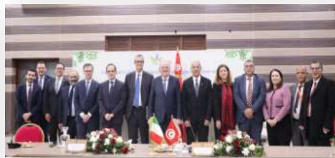
Le Ministre de l'Environnement Habib Abeid rencontre son homologue italien Gilbertou PICHETOU FRATIN, Ministre de l'Environnement et de la Sécurité énergétique, 31 Janvier 2025