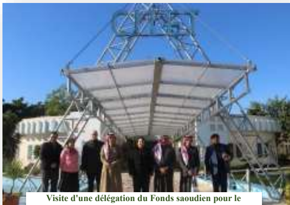
Visite d'une délégation du Fonds saoudien pour le développement au Centre